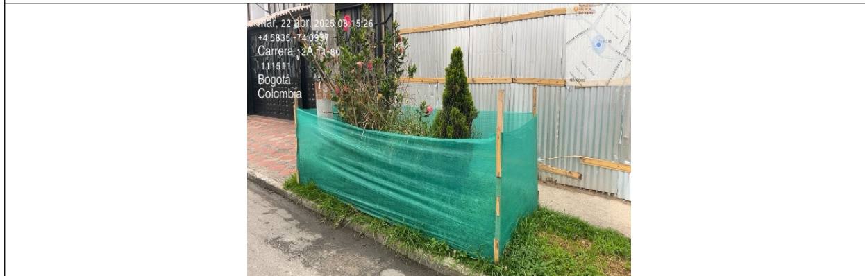
Fotografías No. 3. Medida correctiva: protección de individuos arbóreos